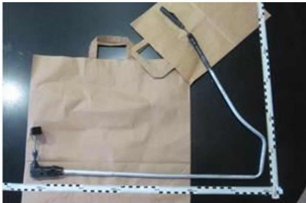
Slunga, som sticks in i brevlådeinkast